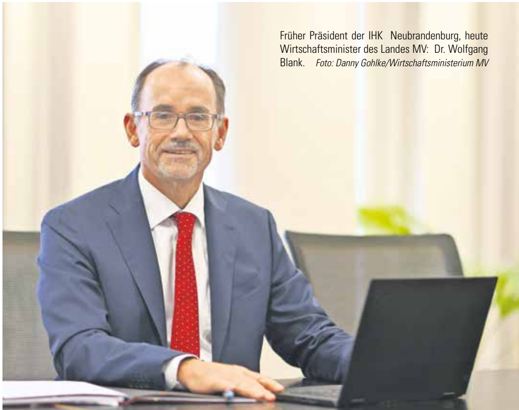
Früher Präsident der IHK Neubrandenburg, heute Wirtschaftsminister des Landes MV: Dr. Wolfgang Blank.

NEUBRANDENBURG. Gut sechs Monate nach Beginn seiner dritten Legislaturperiode als Präsident der IHK Neubrandenburg für das östliche Mecklenburg-Vorpommern ist Dr. Wolfgang Blank zum Wirtschaftsminister des Landes Mecklenburg-Vorpommern berufen worden. Das war Mitte Dezember des vergangenen Jahres. Wie es ihm bisher in seinem neuen Amt ergangen ist, was er sich für die kommenden Monate vorgenommen hat und wie ihm sein früheres langjähriges ehrenamtliches Engagement bei der IHK-Organisation heute weiterhilft, dazu ist „Faktor Wirtschaft“ mit dem Wirtschaftsminister wenige Wochen nach seinem Amtsantritt ins Gespräch gekommen.