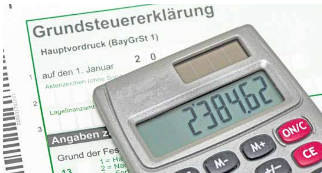
Mehr Kosten: Die Grundsteuerreform hat zu teils erheblichen Erhöhungen der Realsteuerhebesätze für Grundstücke geführt.

Die Hebesätze der Grundsteuer A für landwirtschaftliche Grundstücke nähern sich diesen Werten an. In der Mecklenburgischen Seenplatte liegt Pripert mit 700 Prozent über dem höchsten Grundsteuer B-Hebesatz von Neubrandenburg. Grünow folgt mit 640, Zettemin mit 603 Prozent. Zehn Kom-