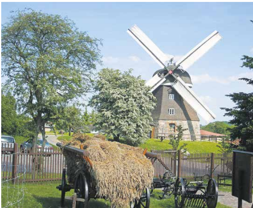
Woldegk im Frühjahr: Die Museumsmühle auf dem Mühlenberg ist auch Veranstaltungsort des Festprogrammes.

Für Sportbegeisterte aus nah und fern ist außerdem ein Sportfest geplant. Höhepunkt soll eine gemeinsame Radtour mit den Nachbarstädten Friedland und Straßburg sein. Letztere begeht in diesem Jahr ebenfalls ihr 775-jähriges Jubiläum. „Gemeinsam wollen wir die Städte verbinden und die Traditionen lebendig werden lassen. Für den kulturellen Austausch zwischen den Orten ist eine ‚Museumsnacht‘ vorgesehen, wo die Besucher mit einem Shuttlebus von Stadt zu Stadt fahren und in vergangene Zeiten reisen dürfen. In diesem Rahmen ist in der Museumsmühle auf dem Woldegker Mühlenberg eine plattdtsche Vorführung geplant“, kündigt die Stadt an.