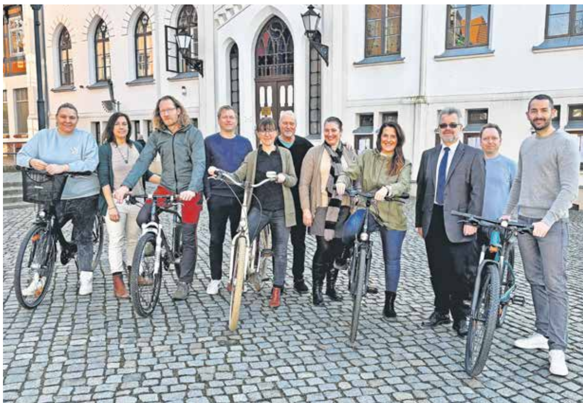
Arbeitsgruppe „Radregion Seenplatte 2034“ in Waren (Müritz): Das Land der 1000 Seen soll sich zu einem Top-Ziel für Radreisende entwickeln.

Mitstreiter entwickeln neue Ansätze für Marktentwicklung, Positionierung und Produktgestaltung