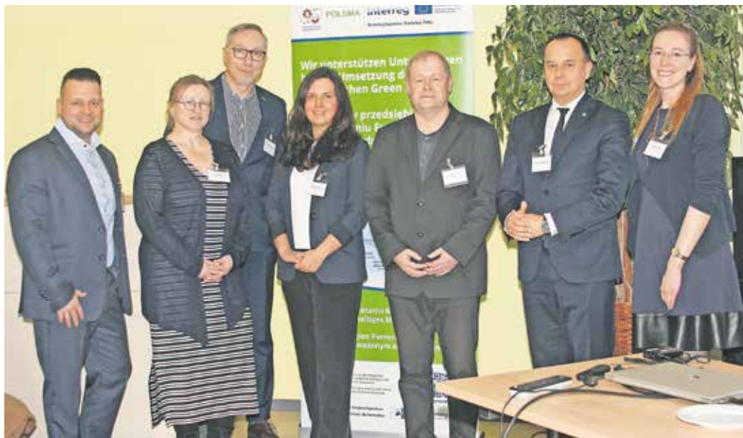
POLSMA-Team: Es unterstützt die Unternehmen aus der deutsch-polnischen Grenzregion bei der Umsetzung der Vorgaben aus dem europäischen Green Deal.

Projektteam stellt sich erstmals Unternehmern und Netzwerkpartnern in Prenzlau vor