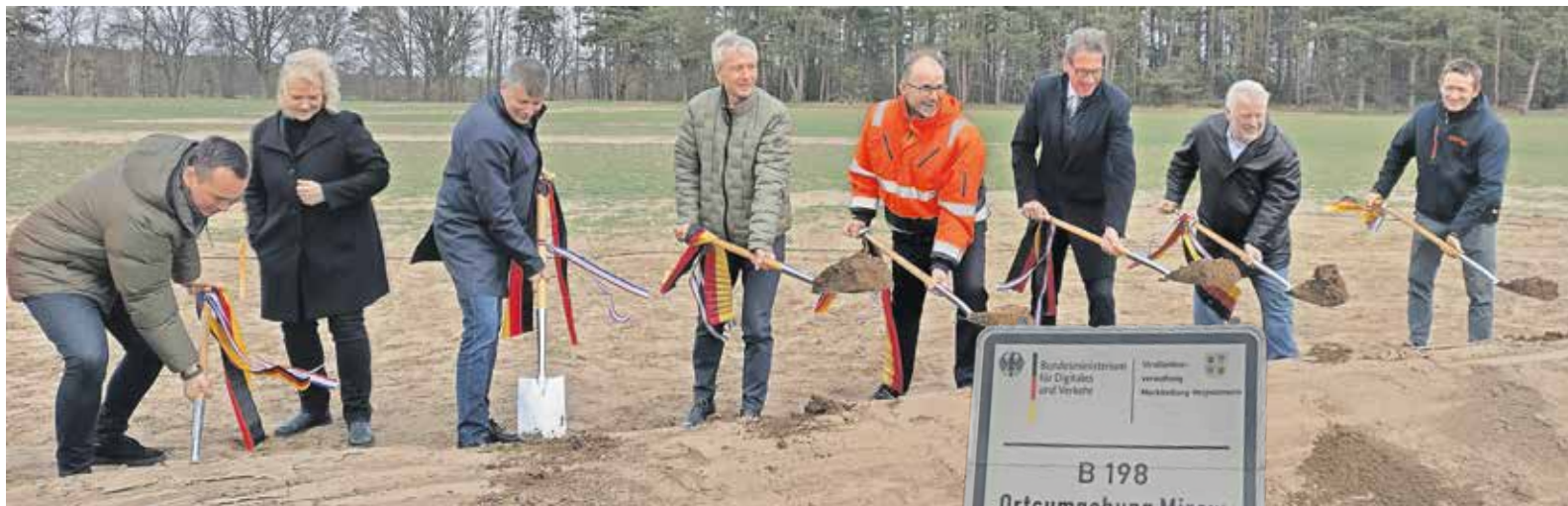
Feierlicher Spatenstich für die Ortsumgehung Mirow: Den Bau hat die IHK jahrelang gefordert.

Mehr als 50 Millionen Euro werden dieses Jahr in die Infrastruktur investiert