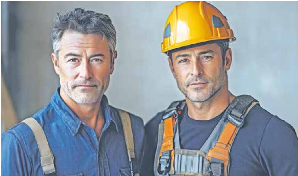
Neue Chancen für Ungelehrte: Auch Berufserfahrung kann jetzt anerkannt werden.

Abhängig vom Ergebnis bescheinigt die IHK Neubrandenburg für das östliche Mecklenburg-Vorpommern die vollständige oder die überwiegende