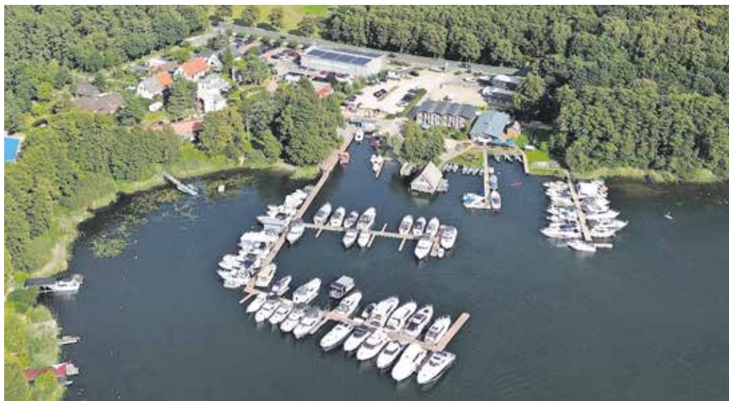
Yachtcharter Schulz: Das Unternehmen in Waren an der Müritz ist über die Jahre kontinuierlich gewachsen.

WAREN (MÜRITZ). Yachtcharter Schulz feiert dieser Tage 30 Jahre Unternehmensgeschichte und blickt auf eine Zeit voller Wachstum und Leidenschaft für den Wassersport zurück. Seit der Gründung im Jahr 1995 hat sich das Unternehmen zu einem nach eigenen Angaben führenden Anbieter für Yacht- und Hausbootcharter in Deutschland entwickelt.