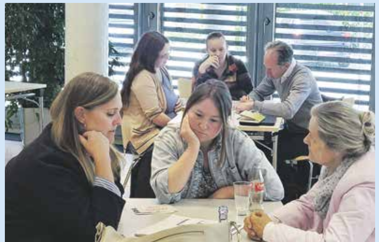
Die „Transformationsreise Wirtschaft 2025“ ist gestartet: In der IHK Neubrandenburg finden sich die ersten Tandempartner zusammen.