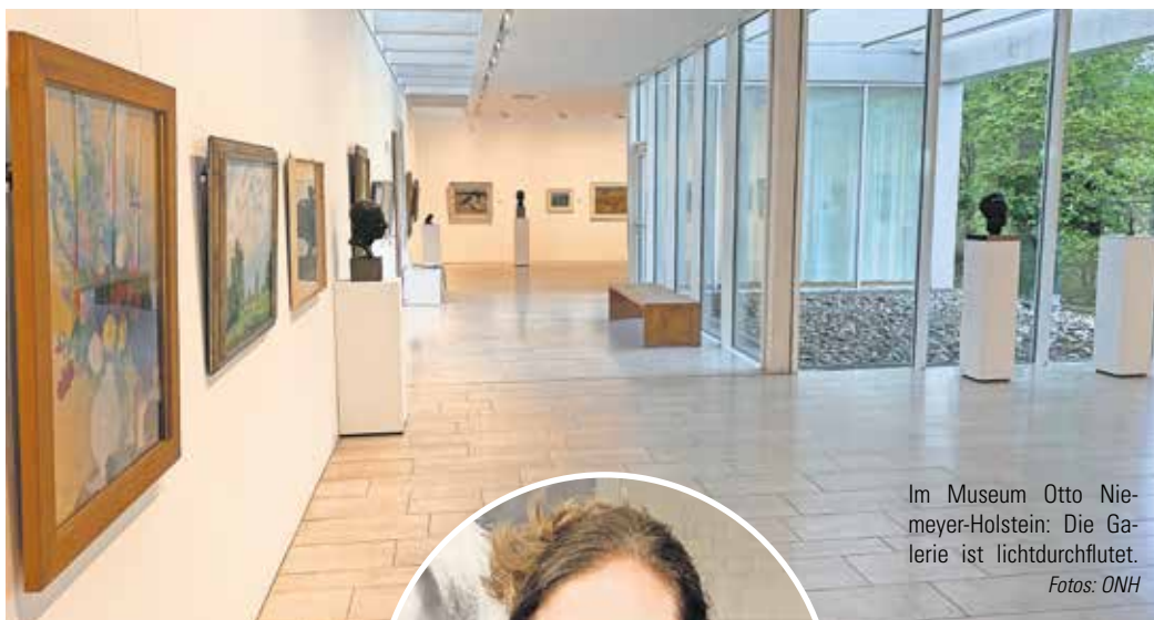
Im Museum Otto Niemeyer-Holstein: Die Galerie ist lichtdurchflutet.