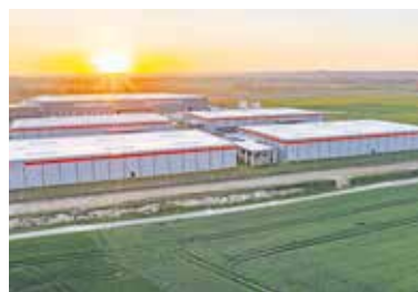
Blick auf die vier bestehenden Hallen: In den neuen werden Solarcarports gebaut.