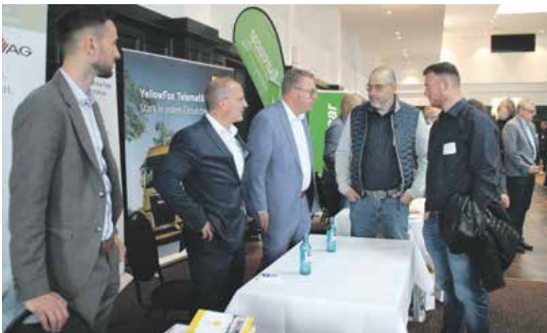
Begleitende Fachausstellung: Draußen standen auch Fahrzeuge mit unterschiedlichster Antriebstechnik – vom Oldtimer bis zum Wasserstoffbus.